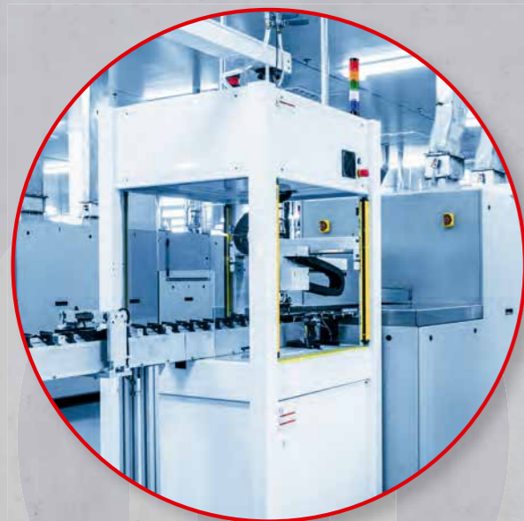
KombiSIGN 40 para fabricação de equipamentos, máquinas menores, transporte e logística